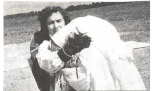
Пенка Недялкова - майстор на спорта по парашутизъм, международен състезател с шест златни медала, носител на „Народен орден на труда“ - златен, и удостоена от Международната федерация по веронавтика - Париж, 1989 г. Снимката е от Млада Болеслав, Чехия, юни 1961 г.