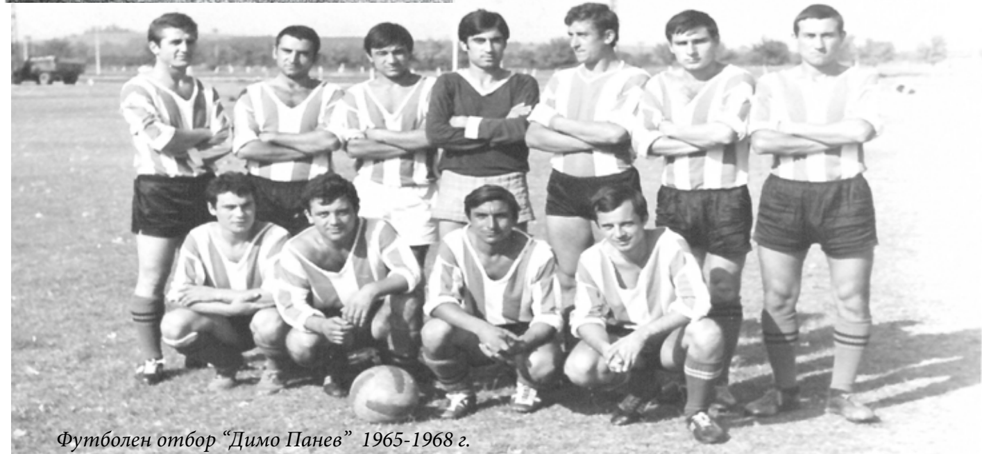
Футболен отбор „Димо Панев“ 1965-1968 г.