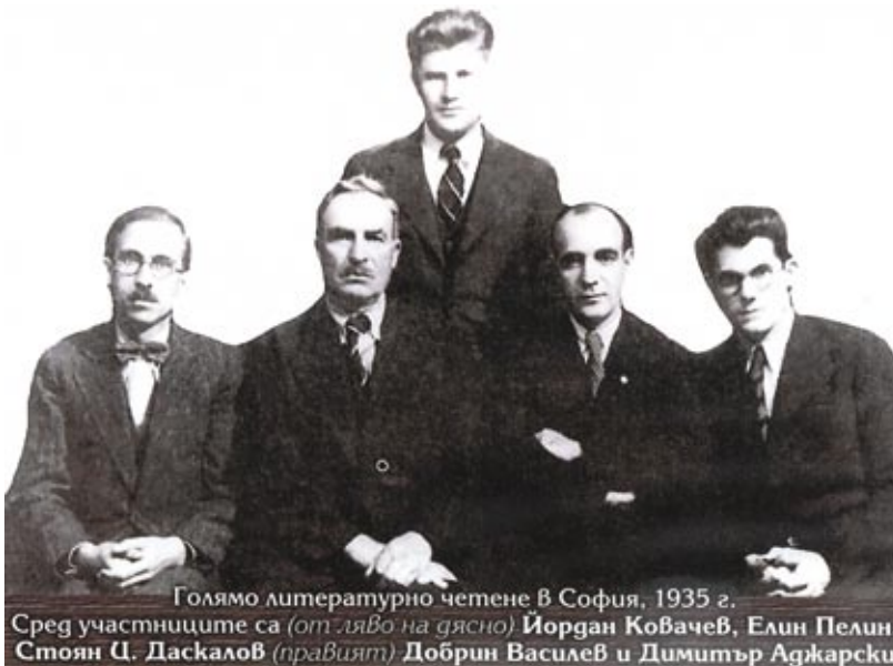
Голямо литературно четене в София, 1935 г.